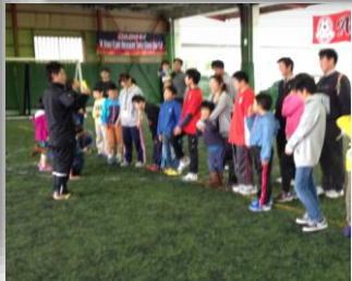
いつもの練習も、お父さんと一緒に、いっしょにみせるぞ!