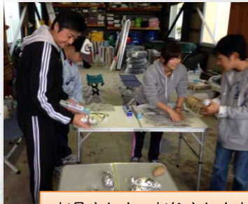
お母さんも、お父さんもおいしい焼き芋、いも煮に真剣!