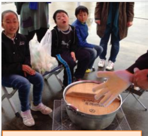
まちどおいしい! 早くふたをあけてよ!