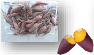
今年は豊作!って本当?

11月1日(土曜日)ちょっと曇り空の中、アバンツアーレスポーツの第一回収穫祭が行われました。収穫物は裏の畑で採った“さつまいも”です。子供たちがさつまいもを新聞紙で包み、水でめらし、アルミホイルで巻きました。後は、炭火の中に入れて焼き上げるのを待ちます。最初はなかなか焼き上がらずイライラ?その内に隣でお母さん方が作っていた豚汁が湯気を立てはじめおいしそうなおい漂ってきました。子供たちとお父さんはちょっと我慢しながら室内練習場で、サッカーの練習。お母さんたちは・・・? 練習の後で、プレイルームで皆でしっかり味わいました。